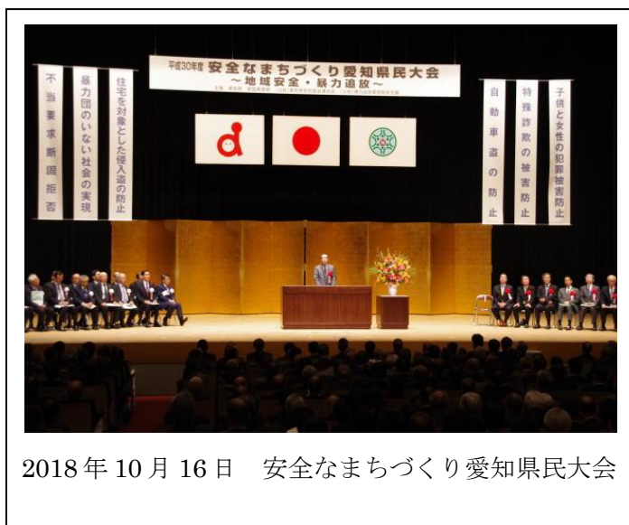
2018年10月16日 安全なまちづくり愛知県民大会