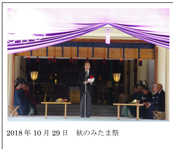
2018年10月29日 秋のみたま祭

愛知県議会を代表してたくさんの公式行事、各種会議・会合に出席しています。詳しくは松川こうめいホームページの写真集をご覧ください。幸いです。