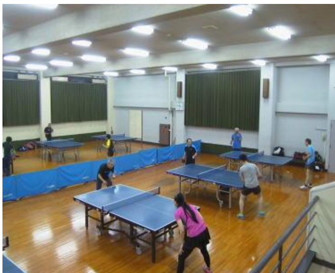
写真1 第2競技場 卓球台が20台設置されています。土日祝日ともなると満卓状態で、待つて並んでいる方もみえます。

当会館は利用料金が極めて安価の設定となっています。たとえば卓球台を個人で1日ご利用いただいても、中学生以下の者150円、学生・高校生350円、その他の者600円となっています。駐車場も当会館の利用者は無料で106台まで駐車できます。