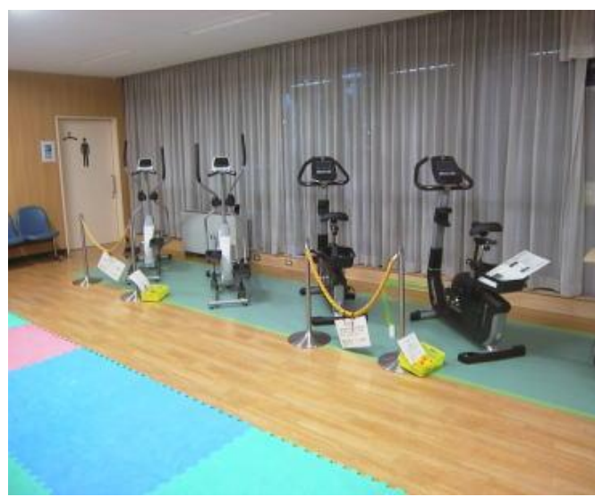
写真2 ウェルネスルーム 器具の使用料は無料です。当ルームには、ロッカー・シャワーが在り、名城公園をジョギングされる方たちにもご利用いただいています。

写真1 第2競技場 卓球台が20台設置されています。土日祝日ともなると満卓状態で、待つて並んでいる方もみえます。